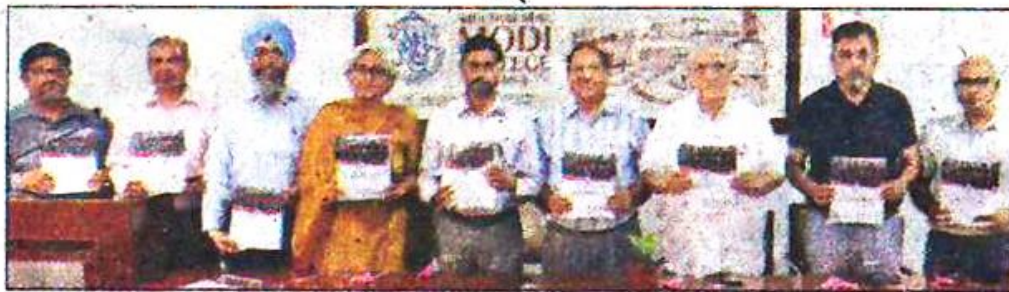
ਪ੍ਰਾਸਪੈਕਟਸ ਰਿਲੀਜ਼ ਕਰਦੇ ਹੋਏ ਕਾਲਜ ਸਟਾਫ ਮੈਂਬਰ।