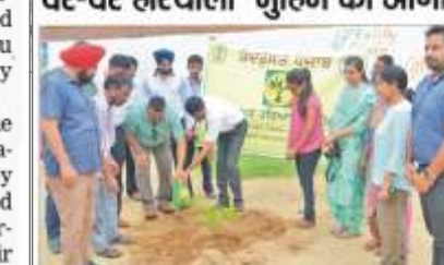
ਮੋਦੀ ਕਾਲੇਜ ਮੇਂ 'ਤੰਦਰੁਸਤ ਪੰਜਾਬ : ਧਰ-ਧਰ ਹਰਿਆਲੀ' ਮੁਹਿਮ ਦਾ ਆਗਾਜ ਕਰਨ ਦਾ ਦ੍ਰਿਸ਼।