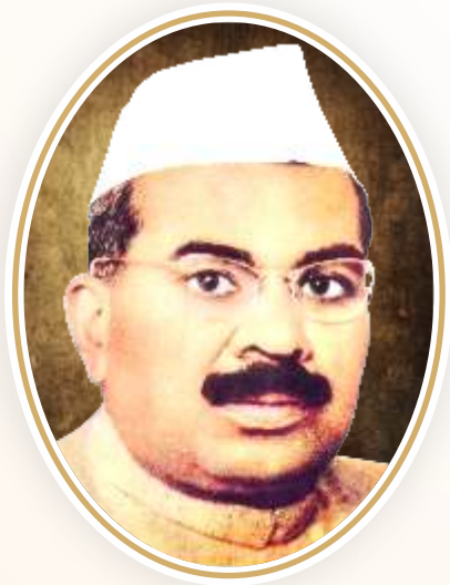
Padma Bhushan Rai Bahadur Seth Gujjar Mal Modi

A Visionary Entrepreneur & Builder of Modi Industrial Empire