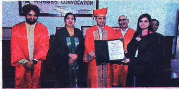
विद्यार्थी अपनी डिग्री प्राप्त करते हुए।

ने मुख्य मेहमान का स्वागत करते और विद्यार्थियों को बधाई देते कालेज की शैक्षिक, खेल और सह-पाठ्यक्रम आधारित गतिविधियों के क्षेत्र में से प्रतियोगिताओं के रिपोर्ट पेश की। उन्होंने बताया कि मोदी कालेज शिक्षा के क्षेत्र में विद्यार्थियों को भविष्य के राष्ट्र निर्माताओं और जिम्मेदार नागरिकों के तौर पर विकसित करने के लिए भी वचनबद्ध है। इस मौके पर ग्रेजुएट