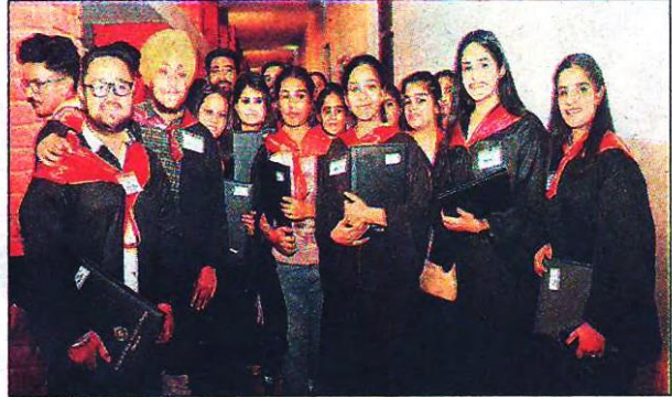
ਮੁਲਤਾਨੀ ਮੱਲ ਮੋਦੀ ਕਾਲਜ ਵਿਖੇ ਸਾਲਾਨਾ ਕਨਵੋਕੇਸ਼ਨ ਸੰਬੰਧੀ ਕਰਵਾਏ ਪ੍ਰੋਗਰਾਮ ਦਾ ਦ੍ਰਿਸ਼।