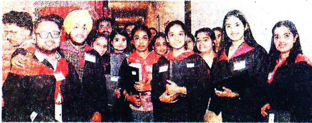
ਵਿਦਿਆਰਥੀ ਆਪਣੀਆਂ ਡਿਗਰੀਆਂ ਦੇ ਨਾਲ।