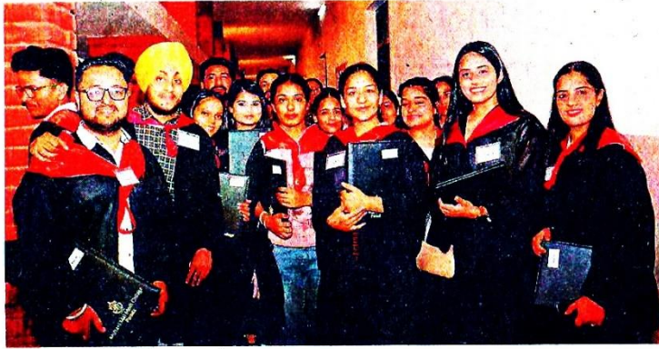
मोदी कॉलेज में कन्वोकेशन के दौरान डिग्री हासिल करने पहुंचे विद्यार्थी।

कन्वोकेशन की शुरुआत सरस्वती वंदना और शबद गान के साथ हुई और कॉलेज के एनसीसी विंग ने मुख्य मेहमानों को गार्ड ऑफ आनर पेश किया। कॉलेज प्रिंसिपल डॉ. खुशविंदर कुमार ने मुख्य-मेहमान का स्वागत किया। इस मौके पर ग्रेजुएट और पोस्ट ग्रेजुएट