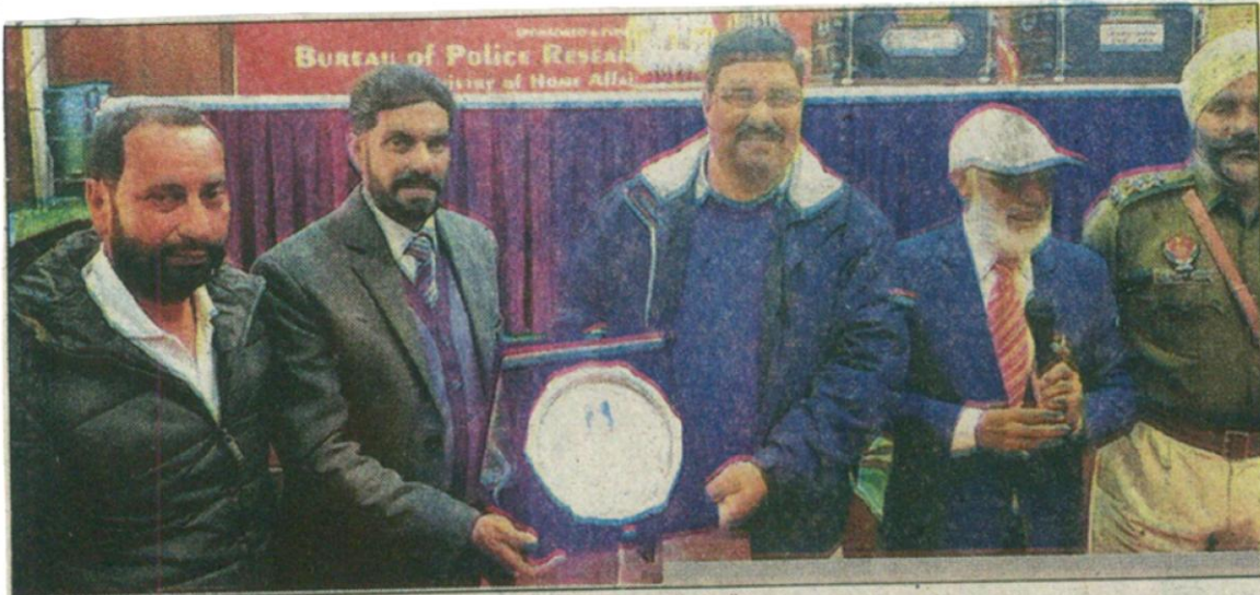
ਪੰਜਾਬ ਜੇਲ੍ਹ ਟ੍ਰੇਨਿੰਗ ਸਕੂਲ ਵਿਖੇ ਰਾਸ਼ਟਰੀ ਯੂਥ ਦਿਵਸ ਮਨਾਏ ਜਾਣ ਦਾ ਦ੍ਰਿਸ਼।