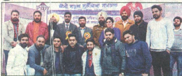
‘ਰਾਸ਼ਟਰੀ ਸੁਰੱਖਿਆ ਸਪਤਾਹ’ ਮੌਕੇ ਵਿਦਿਆਰਥੀਆਂ ਨਾਲ ਯਾਦਗਾਰੀ ਤਸਵੀਰ ਖਿਚਵਾਉਂਦੇ ਪਤਵੰਤੇ ਸੱਜਣ।