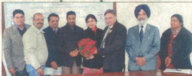
ਫੈਕਲਟੀ ਡਿਵੈਲਪਮੈਂਟ ਪ੍ਰੋਗਰਾਮ ਮੌਕੇ ਸਨਮਾਨਿਤ ਕਰਨ ਦਾ ਦ੍ਰਿਸ਼। (ਗੁਪਤਵਿੰਦਰ)

ਜ਼ਰੂਰੀ ਹੈ। ਹੜਤਾ ਭਰ ਚੱਲਣ ਵਾਲੇ ਇਸ ਪ੍ਰੋਗਰਾਮ ਵਿੱਚ ਵੱਖ-ਵੱਖ ਯੂਨੀਵਰਸਿਟੀਆਂ ਤੋਂ ਆਏ ਉੱਚਕੋਟੀ ਦੇ ਵਿਦਵਾਨਾਂ ਨੇ ਅਧਿਆਪਕਾਂ ਨਾਲ ਵਿਚਾਰ-ਵਟਾਂਦਰਾ ਕੀਤਾ।