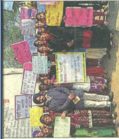
Wrestling team of Multani Mal Modi College with their award in Fatehgarh Sahib; (right) and NSS volunteers of University College taking out an awareness rally at Miranpur in Patiala.