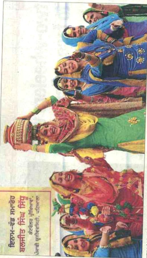
Students taking part in competitions and audience at Mandi Mooli College in Patiala on Friday.