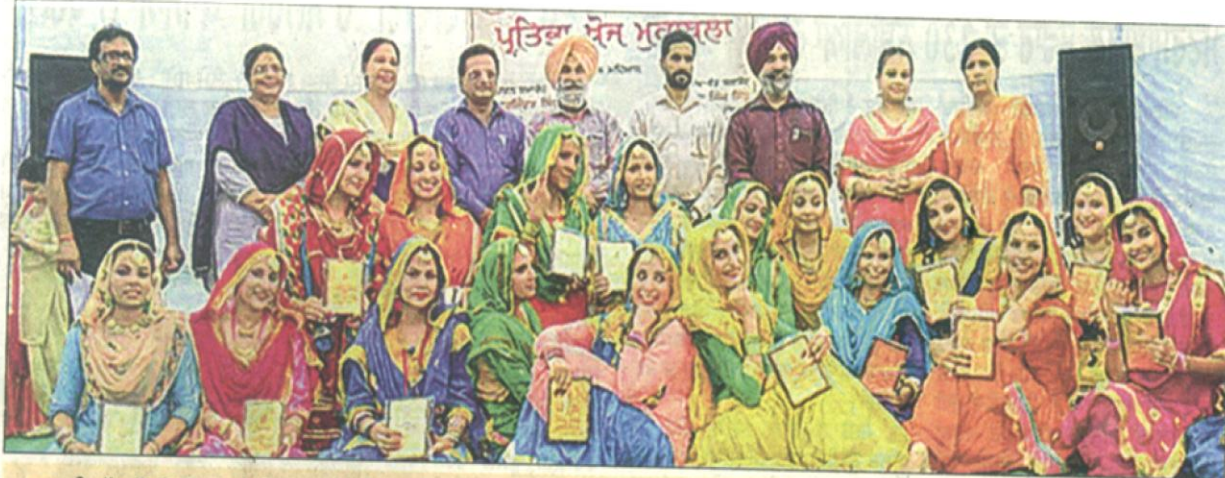
ਮੁਲਤਾਨੀ ਮੱਲ ਮੋਦੀ ਕਾਲਜ ਵਿਖੇ ਕਰਵਾਏ ਗਏ ਸੱਭਿਆਚਾਰਕ ਪ੍ਰੋਗਰਾਮ ਦਾ ਦ੍ਰਿਸ਼।