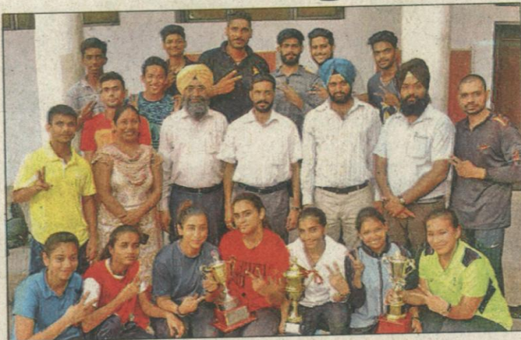
ਮੋਦੀ ਕਾਲਜ ਦੇ ਸਟਾਫ ਨਾਲ ਜੇਤੂ ਟੀਮ ਦੇ ਖਿਡਾਰੀ।

ਸਟਾਫ ਰਿਪੋਰਟਰ, ਪਟਿਆਲਾ : ਮੁਲਤਾਨੀ ਮੱਲ ਮੋਦੀ ਕਾਲਜ ਦੇ ਖਿਡਾਰੀਆਂ ਨੇ ਪੰਜਾਬੀ ਯੂਨੀਵਰਸਿਟੀ ਅੰਤਰ ਕਾਲਜ ਵੁਡੂ ਚੈਂਪੀਅਨਸ਼ਿਪ ਜਿੱਤਣ ਮਾਣ ਹਾਸਲ ਕੀਤਾ ਹੈ। ਪੰਜਾਬੀ ਯੂਨੀਵਰਸਿਟੀ ਵਲੋਂ ਕਰਵਾਈ ਇਸ ਚੈਂਪੀਅਨਸ਼ਿਪ ਵਿਚ ਵੱਖ-ਵੱਖ ਕਾਲਜਾਂ ਦੀਆਂ 15 ਟੀਮਾਂ ਨੇ ਹਿੱਸਾ ਲਿਆ। ਸਖ਼ਤ ਮੁਕਾਬਲਿਆਂ ਦੌਰਾਨ ਵੁਡੂ ਦੇ ਦੋਵੇਂ ਇਵੇਂਟ ਤਾਲੂ ਅਤੇ ਸਾਂਸੂ ਵਿਚ ਮੋਦੀ ਕਾਲਜ ਦੀਆਂ ਲੜਕੀਆਂ ਨੇ ਜਿੱਤ ਹਾਸਲ ਕੀਤੀ। ਸਾਂਸੂ ਇਵੇਂਟ ਵਿਚ ਸਰਕਾਰੀ ਰਾਜਿਦਰਾ ਕਾਲਜ ਬਠਿੰਡਾ ਦੀਆਂ ਲੜਕੀਆਂ ਦੂਜੇ ਨੰਬਰ 'ਤੇ ਰਹੀਆਂ ਅਤੇ ਤਾਲੂ ਇਵੇਂਟ ਵਿਚ ਸਰਕਾਰੀ ਕਾਲਜ ਫ਼ਾਰ ਗਰਲਜ਼, ਪਟਿਆਲਾ ਦੀਆਂ ਲੜਕੀਆਂ ਨੇ ਦੂਜਾ ਸਥਾਨ ਹਾਸਲ ਕੀਤਾ। ਇਸ ਖੇਡ ਦੇ ਲੜਕੀਆਂ ਦੇ ਸਾਂਸੂ ਦੇ ਮੁਕਾਬਲੇ ਵਿਚ ਮੋਦੀ ਕਾਲਜ ਦੀ ਟੀਮ ਨੇ ਪਹਿਲਾ ਸਥਾਨ ਪ੍ਰਾਪਤ ਕੀਤਾ ਤੇ ਗੁਰੂ ਨਾਨਕ ਕਾਲਜ, ਬੁਢਲਾਡਾ ਦੀ ਟੀਮ ਦੂਸਰੇ ਸਥਾਨ 'ਤੇ ਰਹੀ। ਲੜਕੀਆਂ ਦੇ ਤਾਲੂ ਇਵੇਂਟ ਵਿਚ ਸਰਕਾਰੀ ਮਹਿੰਦਰਾ ਕਾਲਜ, ਪਟਿਆਲਾ ਨੇ ਪਹਿਲਾ ਸਥਾਨ ਅਤੇ ਮੋਦੀ ਕਾਲਜ ਦੀ ਟੀਮ ਨੇ ਦੂਸਰਾ ਸਥਾਨ ਪ੍ਰਾਪਤ ਕੀਤਾ। ਇਸੇ ਤਰ੍ਹਾਂ ਲੜਕੀਆਂ ਅਤੇ ਲੜਕੀਆਂ ਦੀ ਓਵਰਆਲ