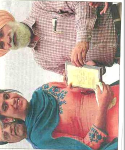
Students taking part in competitions and audience at Mandi Mooli College in Patiala on Friday.