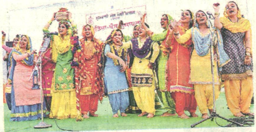
प्रोग्राम में गिद्धा की पेशकारी देती स्टूडेंट्स।