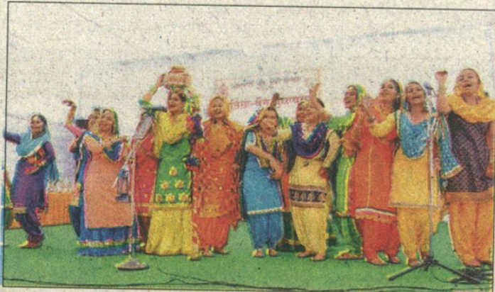
ਮੋਦੀ ਕਾਲਜ 'ਚ ਪ੍ਰਤਿਭਾ ਖੋਜ ਮੁਕਾਬਲੇ 'ਚ ਗਿੱਧਾ ਪੇਸ਼ ਕਰਦੀਆਂ ਵਿਦਿਆਰਥਣਾਂ।