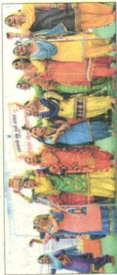
ਪ੍ਰਤਿਭਾ ਖੋਜ ਮੁਕਾਬਲੇ ਵਿੱਚ ਗਿੱਧਾ ਪਾ ਰਹੀਆਂ ਵਿਦਿਆਰਥਣਾਂ। ਡੇ. ਡਿੱਡ