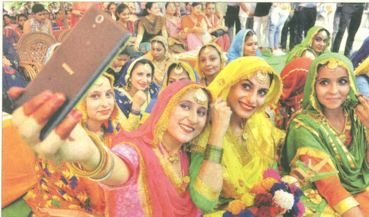
ONE FOR THE ALBUM: Girls take a groupie during a talent hunt competition at Multani Mal Modi College in Patiala on Friday.