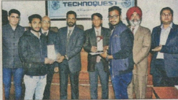
पटियाला के मोदी कॉलेज में स्टूडेंट को सम्मानित करते प्रिंसिपल।

प्रतियोगिता में वेब डिजाइनिंग में माता गुजरी कालेज फतेहगढ़ साहिब