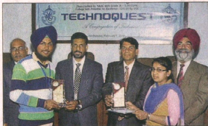
Winners being awarded during the inter-institution IT Fest at MM Modi College in Patiala on Wednesday.