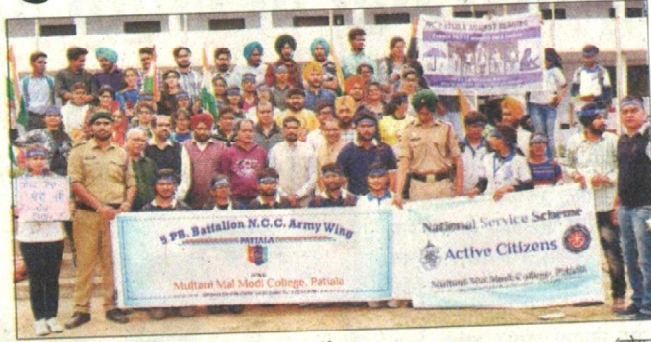
प्रदर्शन करते मोदी कालेज में विद्यार्थी।