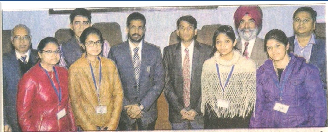
ਮੁਲਤਾਨੀ ਮੱਲ ਮੋਦੀ ਕਾਲਜ ਵਿਖੇ ਕਰਵਾਏ ਦੌਰਾਨ ਸਟਾਫ਼ ਅਤੇ ਵਿਦਿਆਰਥੀ।