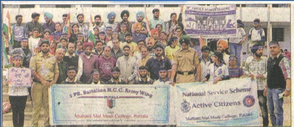
ਮੋਦੀ ਕਾਲਜ ਪਟਿਆਲਾ ਵਿਖੇ ਐਨ. ਸੀ. ਸੀ. ਕੈਂਪ ਦੌਰਾਨ 'ਹਰ ਹੱਥ ਕਲਮ' ਮੁਹਿੰਮ ਦੀ ਸ਼ੁਰੂਆਤ ਦਾ ਦ੍ਰਿਸ਼।