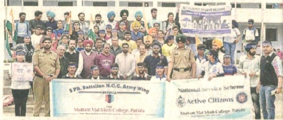
भिखारी मुक्त बनाने वाली टीम जानकारी देते हुए