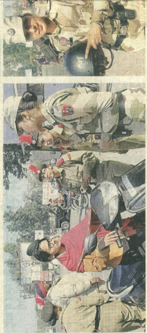
पटियाला के तैला भवन चौक पर यातायात नियमों के बारे में बताती महिला पुलिस कर्मी। (दाएं) आइएसआइ मार्को हेलमेट दिखाती महिला पुलिस मुलाजिम