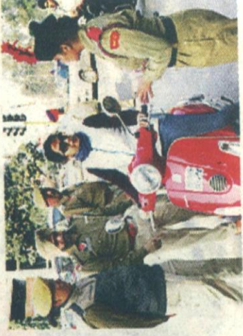
पब्लिक को जागरूक करती जिला ट्रैफिक पुलिस और मोदी कॉलेज के एनसीसी कैडेट्स।