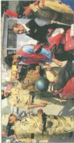
ਪਟਿਆਲਾ ਦੇ ਲੀਲਾ ਭਵਨ ਚੌਕ ਵਿੱਚ ਵਾਹਨ ਚਾਲਕਾਂ ਨੂੰ ਟ੍ਰੈਫਿਕ ਨਿਯਮਾਂ ਬਾਰੇ ਜਾਣਕਾਰੀ ਦਿੰਦੇ ਹੋਏ ਪੁਲੀਸ ਅਧਿਕਾਰੀ।

ਮਾਨ ਰੋਡ, ਕਿਲ੍ਹਾ ਚੌਕ, ਅਦਾਲਤ ਬਾਜ਼ਾਰ, ਅਨਾਰਦਾਣਾ ਚੌਕ, ਏ.ਸੀ. ਮਾਰਕੀਟ, ਚਾਂਦਨੀ ਚੌਕ, ਲੋਅਰ ਮਾਲ ਰੋਡ, ਫੁਹਾਰਾ ਚੌਕ, ਤ੍ਰਿਪਤੀ ਬਜ਼ਾਰ ਤੇ ਗੁਰਬਖਸ਼ ਕਲੋਨੀ ਵਿੱਚ ਮੁਲਾਜ਼ਮਾਂ ਨੇ ਦੁਕਾਨਦਾਰਾਂ ਨੂੰ ਆਪਣੀਆਂ ਦੁਕਾਨਾਂ ਤੋਂ ਬਾਹਰ ਸਾਮਾਨ ਨਾ ਰੱਖਣ ਸਮੇਤ ਬਾਜ਼ਾਰਾਂ ਵਿੱਚ ਵਿਚਰ ਰਹੇ ਲੋਕਾਂ ਨੂੰ ਬਾਜ਼ਾਰਾਂ ਵਿੱਚ ਲੱਗਦੇ ਸਾਮ ਘਟਾਉਣ ਲਈ ਆਪਣੇ ਵਾਹਨਾਂ ਨੂੰ ਨਿਕਧਾਰਿਤ ਥਾਵਾਂ 'ਤੇ ਹੀ ਖੜ੍ਹਾਉਣ ਲਈ ਆਖਿਆ। ਇਸ ਕੜੀ ਵਜੋਂ ਇੱਥੇ ਲੀਲਾ ਭਵਨ ਚੌਕ ਵਿੱਚ ਕਰਵਾਏ ਸਮਾਗਮ ਦੌਰਾਨ ਸਿਲ੍ਹਾ ਟ੍ਰੈਫਿਕ ਇੰਚਾਰਜ ਕਰਨੈਲ