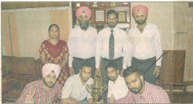
ਮੁਲਤਾਨੀ ਮਲ ਮੋਦੀ ਕਾਲਜ ਮੈਂ ਰੋਡਰਸਾਈਕਲਿੰਗ ਟੀਮ ਕਾ ਸਮਮਾਨ ਕਰਦੇ ਸਟਾਫ਼ ਸਦਸ਼ਯ।