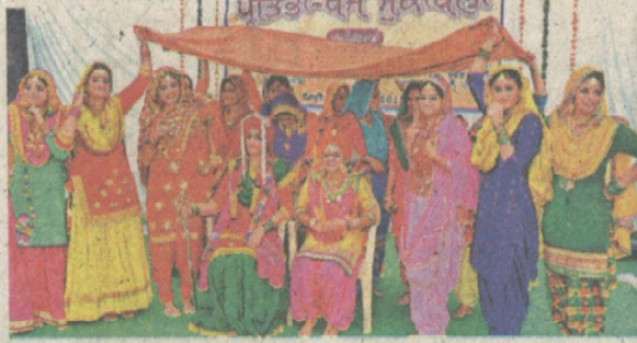
पटियाला के मोदी कॉलेज में गिद्दा पेश करती मुटियारें।