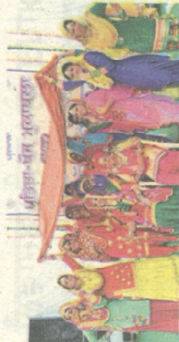
ਮੋਦੀ ਕਾਲਜ ਦੀਆਂ ਵਿਦਿਆਰਥਣਾਂ ਇੱਕ ਆਈਟਮ ਪੇਸ਼ ਕਰਦੀਆਂ ਹੋਈਆਂ।