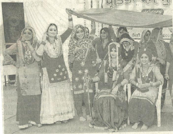
Girls performing gidha during a function at Multani Mal Modi College in Patiala on Wednesday.