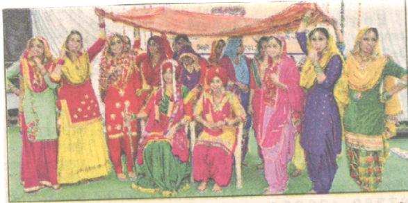
ਮੁਲਤਾਨੀ ਮੱਲ ਮੋਦੀ ਕਾਲਜ ਵਿਖੇ ਪ੍ਰਤਿਭਾ ਖੋਜ ਮੁਕਾਬਲੇ ਦੀ ਇਕ ਝਲਕ।