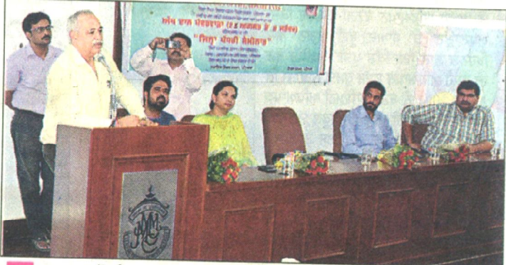
ਸਥਾਨਕ ਮੋਦੀ ਕਾਲਜ ਕਰਵਾਏ ਗਏ ਜ਼ਿਲ੍ਹਾ ਪੱਧਰੀ ਸੈਮੀਨਾਰ ਦੌਰਾਨ ਅੱਖਾਂ ਦਾਨ ਕਰਨ ਬਾਰੇ ਦੱਸਦੇ ਹੋਏ।

ਸਵਾਗਤ ਕਰਦਿਆਂ ਵਿਦਿਆਰਥੀਆਂ ਨੂੰ ਅਪੀਲ ਕੀਤੀ ਕਿ ਅੱਖਾਂ ਦੀ ਦ੍ਰਿਸ਼ਟੀ ਤੋਂ ਵਿਗੁਣੇ ਵਿਅਕਤੀਆਂ ਦੇ ਦਰਦ ਅਤੇ ਗੁਆਂਢ ਵਿਚ ਨੇਤਰਦਾਨ ਬਾਰੇ ਪ੍ਰਚਲਿਤ ਲੋਕਾਂ ਵਿਚਲੇ ਭਰਮ ਭੁਲੱਖੇ ਦੂਰ ਕਰਕੇ ਉਨ੍ਹਾਂ ਨੂੰ ਨੇਤਰਦਾਨ ਵਰਗੇ ਪਵਿੱਤਰ