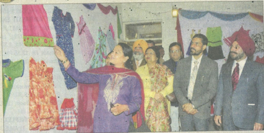
Punjabi actress Sunita Dhir during an exhibition at Multani Mal Modi College in Patiala on Thursday.