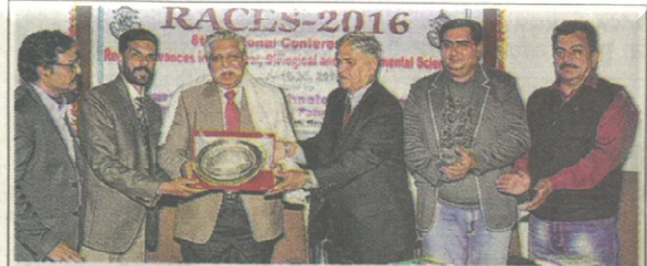
ਮੁਲਤਾਨੀ ਮੱਲ ਮੋਦੀ ਕਾਲਜ ਵਿਚ ਹੋਈ ਕਾਨਫਰੰਸ ਦਾ ਦ੍ਰਿਸ਼।