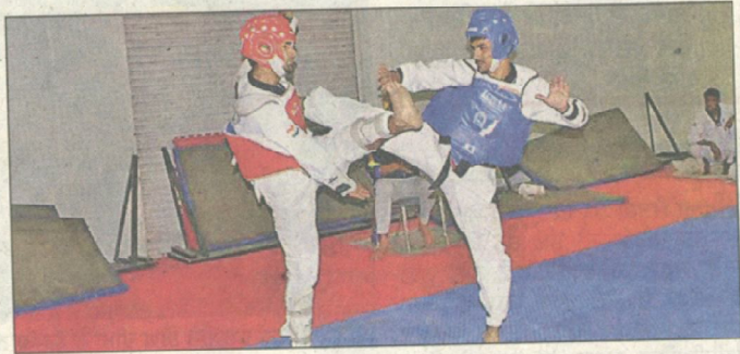
ਮੁਕਾਬਲੇ 'ਚ ਹਿੱਸਾ ਲੈਂਦੇ ਹੋਏ ਖਿਡਾਰੀ।

40 ਕਾਲਜਾਂ ਦੇ ਮਹਿਲਾ/ਪੁਰਸ਼ ਖਿਡਾਰੀ ਲੈ ਰਹੇ ਹਿੱਸਾ