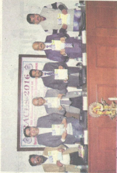
ਕਾਨਫਰੰਸ ਦੌਰਾਨ ਖੋਜਾਰਥੀਆਂ ਦੀਆਂ ਖੋਜਾਂ ਦਾ ਸਮੂਹ ਕਿਤਾਬਰੂ ਰਿਲੀਜ਼ ਕਰਦੇ ਹੋਏ ਪਤਵੰਤੀ-ਫੋਟੋ-ਭੰਡਰ