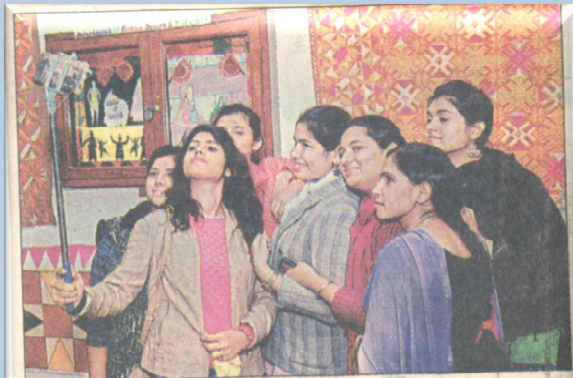
मोदी कालेज में फैशन डिजाइन के विद्यार्थी कला प्रदर्शनी के दौरान अपनी कला प्रदर्शित कर रहे हैं।