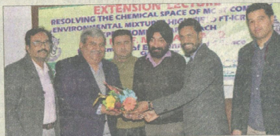
Delegates during the birthday celebrations of Russian chemist and inventor Dmitri Ivanovich Mendeleev at Multani Mal Modi College in Patiala.