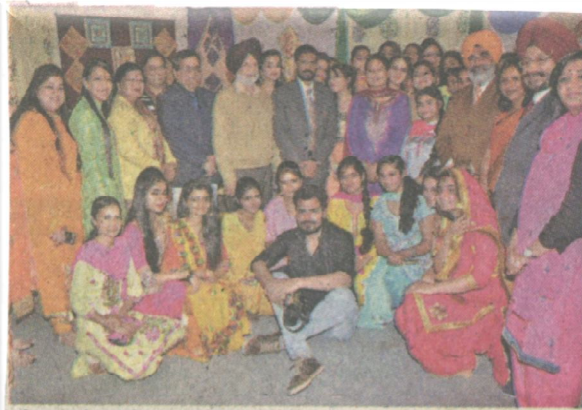
पटियाला के मोदी कालेज में पोशाक प्रदर्शनी में हिस्सा लेने वाले स्टूडेंट्स के साथ मुख्य मेहमान।