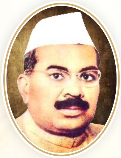
Padma Bhushan Rai Bahadur Seth Gujjar Mal Modi

A Visionary Entrepreneur & Builder of Modi Industrial Empire